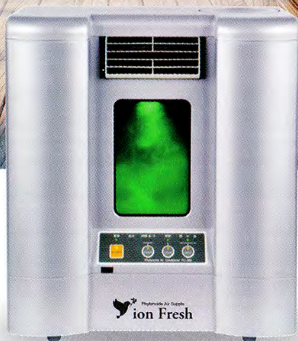
イオンフレッシュ PC-1000 GL

世界初！ フィトンチッドとマイナスイオンを 同時に放出できるエアサプリは 『イオンフレッシュ』だけ！